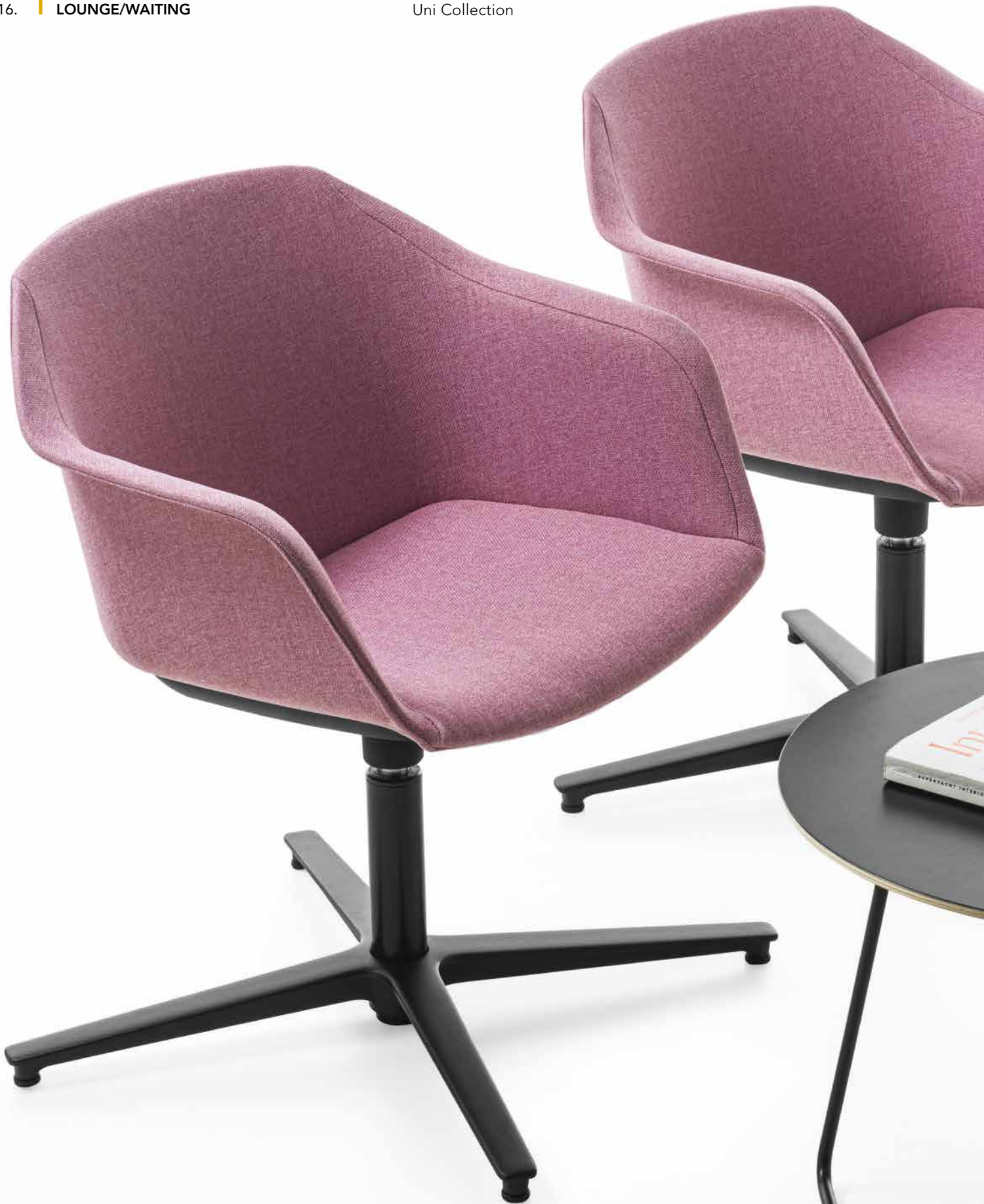
IM Mod. CSI-098U